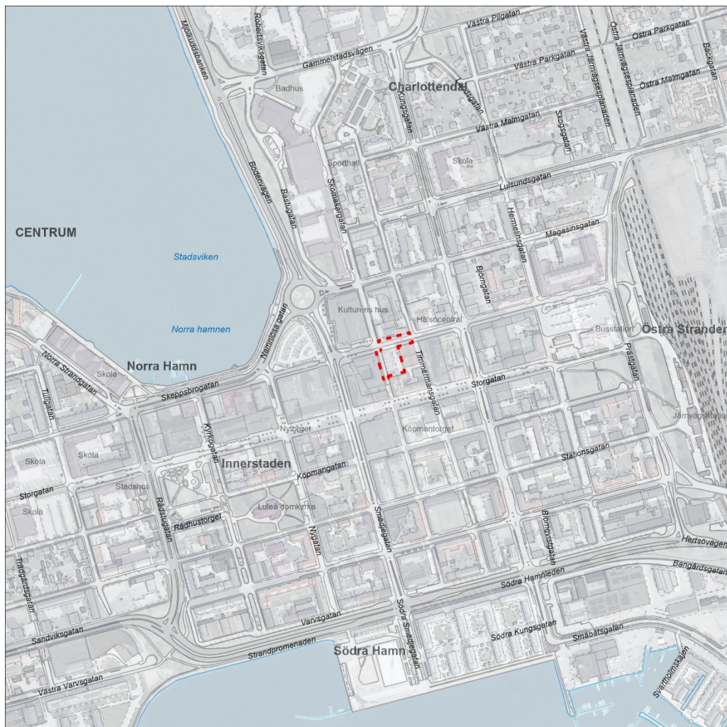
Figur 1: Översiktskarta där fastigheten Katten 6 är markerat i rött

Kommunstyrelsens arbetsutskott beslutade 2021-04-26, § 74 att ge stadsbyggnadsnämnden i uppdrag att upprätta förslag till ny detaljplan och tillhörande gestaltungsprogram för del av Katten 6, i syfte att pröva förutsättningarna för bostäder och verksamheter.