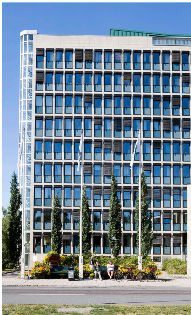
Insjön, våning 2, samt Bottenviken, våning -1, kan bokas av samtliga förvaltningar.

Havet, våning 1 , kan endast bokas av förvaltningarna i stadshuset.